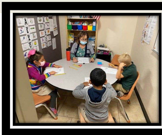
PYP los estudiantes del PYP