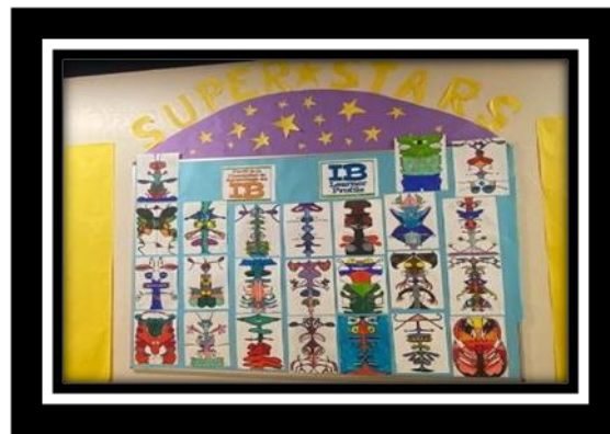
¡¡¡Perfil del IB!!!

El 27 de enero es la Noche de Información para la Exposición de quinto y sexto grado 2021-2022. Los maestros notificarán a los padres con mayor detalles muy pronto. Necesitamos el apoyo de nuestra comunidad para este evento.