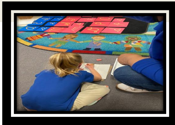
Aprendiendo letra cursiva o de carta y nuestro tablero de positivismo de MYP